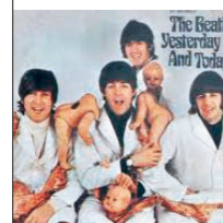
The Beatles: „Yesterday and Today“ (1966)

Die 99 Stück der Erstpressung dieses Industrial-Albums sind um rund 900 Euro pro Exemplar zu haben.