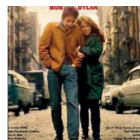
The Freewheelin' Bob Dylan" (1963)

Der Künstler Christian Marclay benutzte bereits in den 1980er-Jahren Vinyl als Stoff für seine Performances: „Mich interessiert, wie Sound visualisiert wird, wie er seine Spuren in der Welt hinterlässt“, sagte Marclay vor ein paar Wochen im profil-Gespräch: „Meine Einflüsse waren Musique Concrète und John Cage. Ich ging oft in billige Junk- und Secondhand-Plattenläden, benutzte die Fundstücke einfach. Die Idee der Sabotage hat mich fasziniert, weil ich aus einer Schweizer Familie komme, in der die wenigen Platten im Haus als sehr