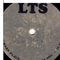
Sex Pistols: „God Save the Queen“ (1977)

Versionen mit dem legendären, verbotenen „Butcher-Cover“ kosten bis zu 12.500 Dollar.